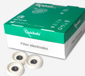
Quickels® Filterelektroden Elektrodenwechsel mind. nach jedem 10. Patienten 1 VPE = 128 Stück

AMEDTEC Medizintechnik Aue GmbH Schneeberger Straße 5 · 08280 Aue Tel.: +49 (0)3771 59 82 70 Fax: +49 (0)3771 59 82 790 info@amedtec.de · www.amedtec.de