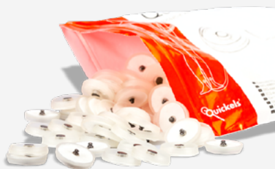
QuickOne® Einmalelektroden Elektrodenwechsel nach jedem Patienten 1 VPE = 1000 Stück